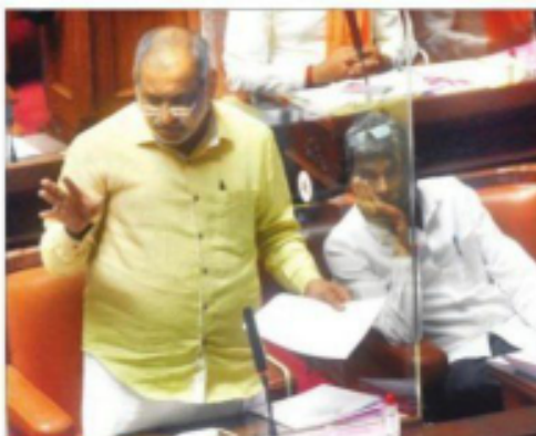
ವಿಧಾನಸಭೆಯಲ್ಲಿ, ನಗರ ಅಧಿಕಾರಿಗಳಲ್ಲಿ ಕಾನೂನು ಸಂವಹನ ವ್ಯಾಪ್ತಿಯ ಆಯ್ಕೆ ಬಿಬಿಎಂಪಿ- 2020 ವಿಧೇಯಕವನ್ನು ಮಂಡಿಸುವರು.

ಬಿಬಿಎಂಪಿ ವಿಧೇಯಕದ ವಿಚಾರವಾಗಿ ಕಾಂಗ್ರೆಸ್ ಅಧಿಕಾರಿಗಳು ವಿಧೇಯಕದ ಸಲಹೆಗೆ ಸಮ್ಮತಿಸುವುದಿಲ್ಲವೆಂದು ಆಕ್ಷೇಪ ವ್ಯಕ್ತಿಸಿ ಕೊಟ್ಟಿದ್ದಾರೆ. ಇದರ ಜೊತೆಗೆ ವಿಧೇಯಕವನ್ನು ಅಂಗೀಕರಿಸುವುದಿಲ್ಲವೆಂದು ಆಕ್ಷೇಪ ವ್ಯಕ್ತಿಸಿ ಕೊಟ್ಟಿದ್ದಾರೆ. ಇದರ ಜೊತೆಗೆ ವಿಧೇಯಕವನ್ನು ಅಂಗೀಕರಿಸುವುದಿಲ್ಲವೆಂದು ಆಕ್ಷೇಪ ವ್ಯಕ್ತಿಸಿ ಕೊಟ್ಟಿದ್ದಾರೆ.